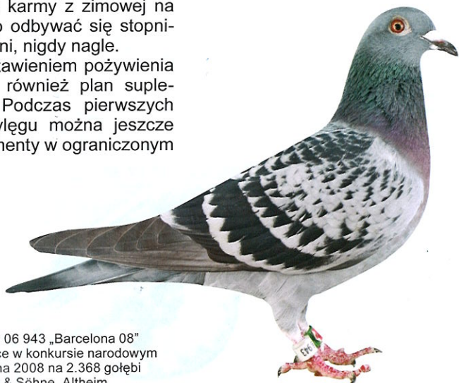
DV 0709 06 943 „Barcelona 08” 1. miejsce w konkursie narodowym Barcelona 2008 na 2.368 gołębi SG Rutz & Söhne, Altheim

Podczas odstawiania młodych ptaków należy zwracać uwagę na jakość ich upierzenia!